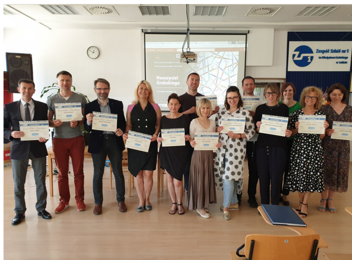
Uczestnicy projektu z certyfikatami

- Na czym polega metoda grywalizacji i „odwróconej klasy”?